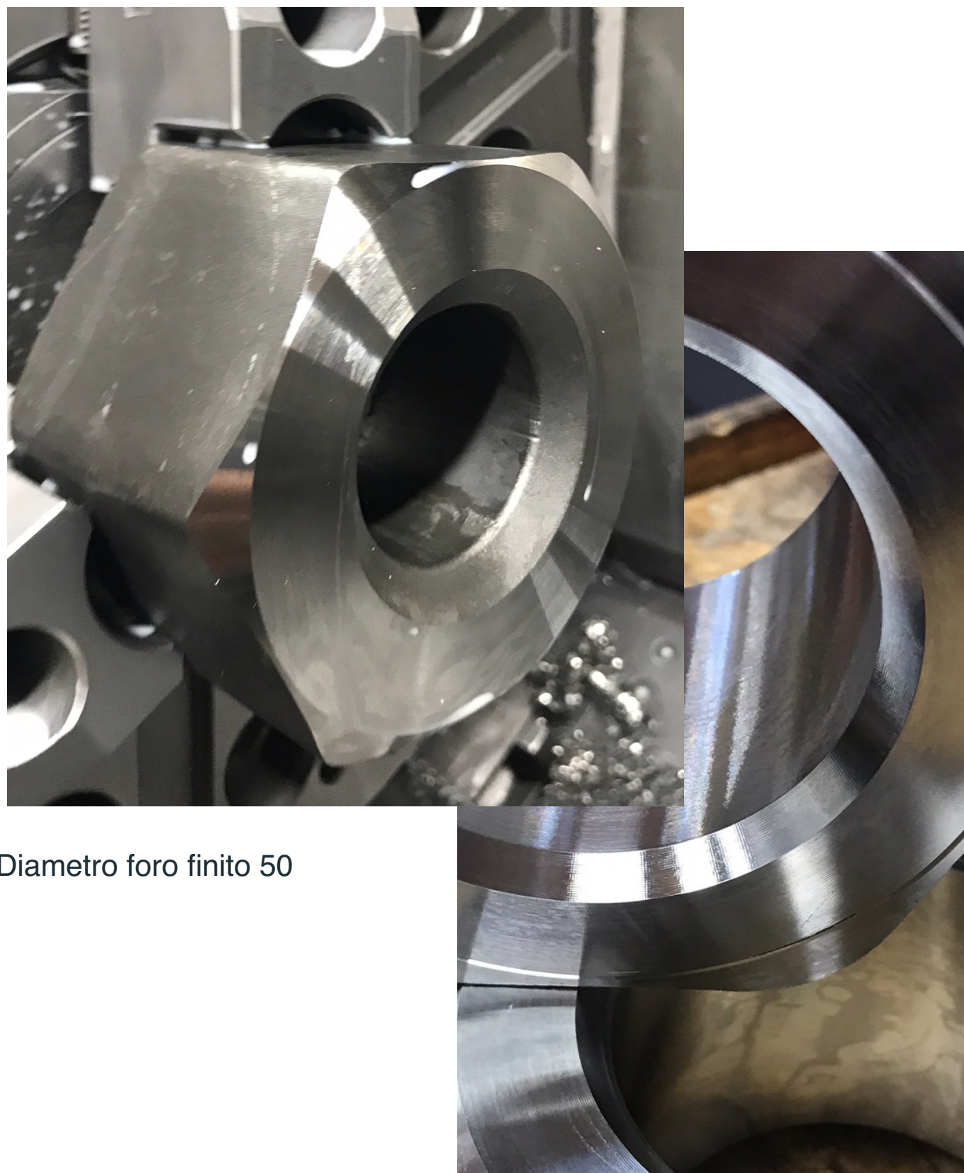
Diametro foro finito 50